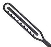
Fièvre > 38°C