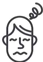
Vertiges / Nausées