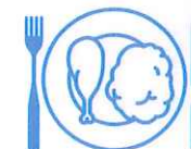
Je mange en quantité suffisante