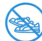
J'évite les efforts physiques