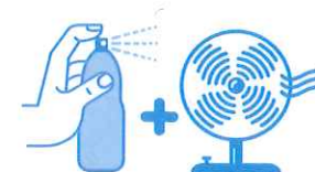
Je mouille mon corps et je me ventile