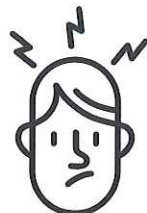
Maux de tête