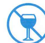
Je ne bois pas d'alcool