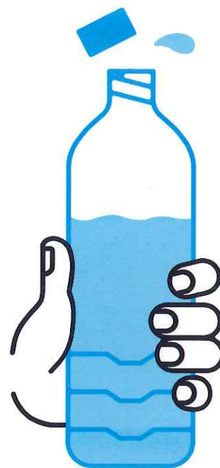
JE BOIS RÉGULIÈREMENT DE L'EAU

En période de canicule, quels sont les bons gestes?